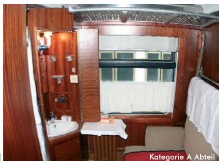
Kategorie A Abteil

Alle Details zu Reiseverlauf und Zugausstattungsowie zur Verlängerung finden Sie in unserem Sonderprospekt „Transsib-Zauber“. Sollte er diesem Katalog nicht beiliegen, dann können Sie ihn kostenlos bei uns anfordern.