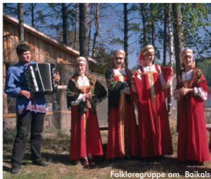
Folkloregruppe am Baikalsee