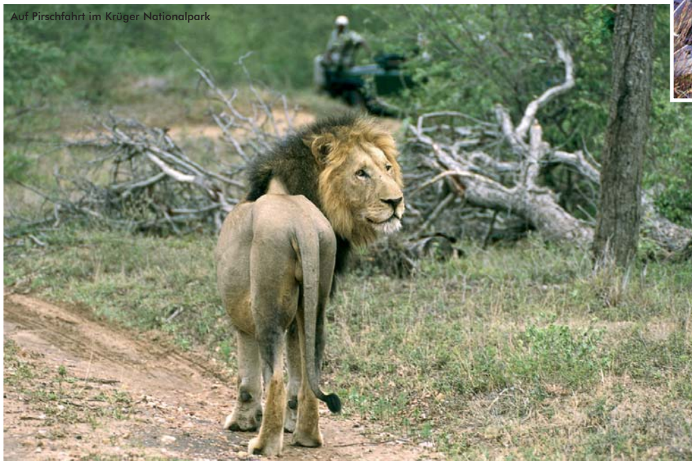
Auf Pirschfahrt im Krüger Nationalpark

Johannesburg, grandiose Canyons, Krüger Nationalpark, Gartenroute, Weinland und Kapstadt