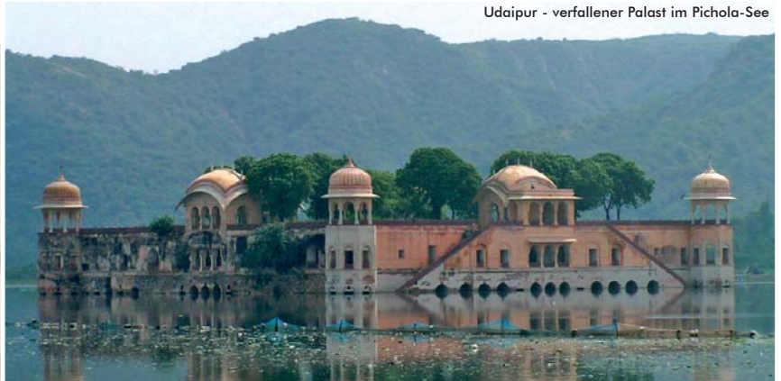
Udaipur - verfallener Palast im Pichola-See