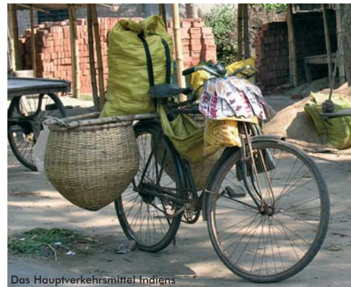
Das Hauptverkehrsmittel Indiens

Nach dem Frühstück geht es zum Flughafen, von wo aus Sie Ihre Heimreise nach Frankfurt antreten.