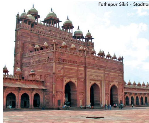
Fatehpur Sikri - Stadttor