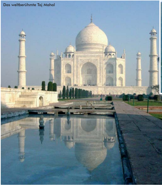
Das weltberühmte Taj Mahal

Taj Mahal, Paläste, fantastische Landschaften und gastfreundliche Menschen. Übernachtung in ausgesuchten Top-Hotels - zum Teil sogar in ehemaligen Maharajapalästen