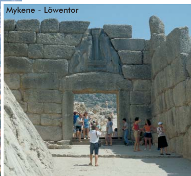
Mykene - Löwentor