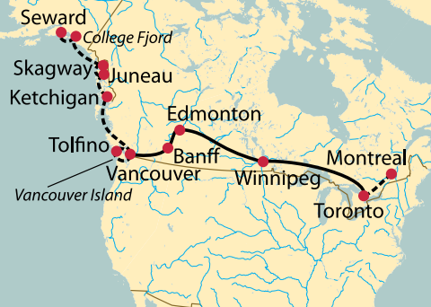
Ihr Zug Rocky Mountaineer