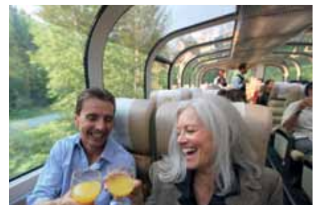
GoldLeaf Class im Rocky Mountaineer

RedLeaf Class In der RedLeaf Class reisen Sie im klimatisierten Großraumwagen, vergleichbar mit einem InterCity. Die Sitze befinden sich in Fahrtrichtung; aus den großen Fenstern können Sie den Ausblick auf die Bergwelt unverstellt genießen. Frühstück und ein kaltes Mittagessen werden am Platz serviert.