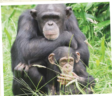
Schimpansen im Kibale National Forest

Veranstalter: Scharff Reisen in Kooperation mit FOX-TOURS Reisen GmbH