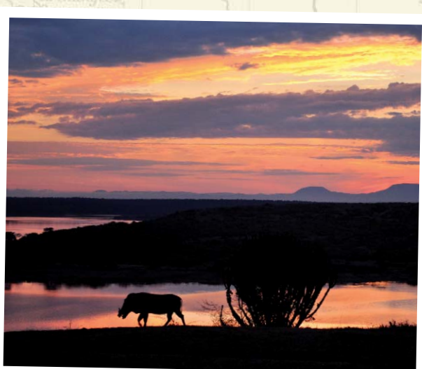
Sonnenaufgang im Queen Elizabeth Nationalpark