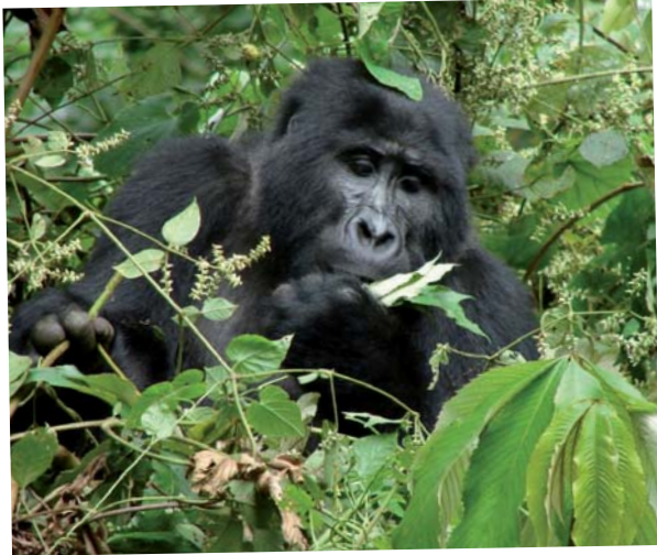
Berggorilla im Bwindi Impenetrable Forest

Erleben Sie Berggorillas aus nächster Nähe!