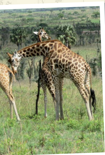
Rothschildgiraffen im Murchinson Nationalpark