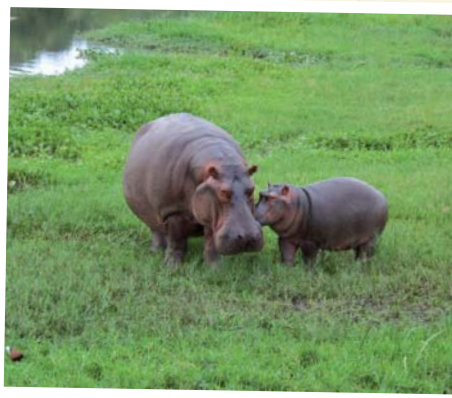
Flusspferde am Kazinga Kanal