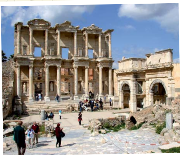
Ephesos - Celsus Bibliothek