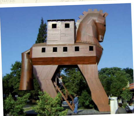
Das berühmte trojanische Pferd vor der Ausgrabung in Troja