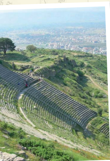
Antikes Theater in Bergama