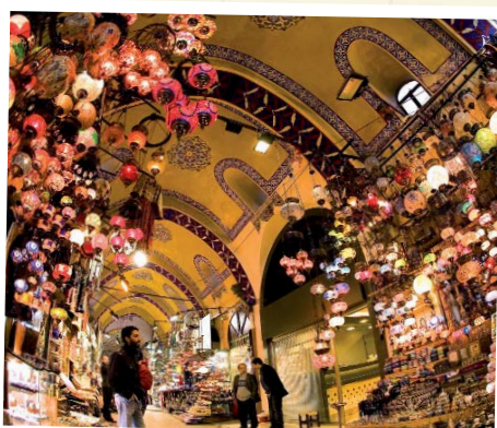
Im ägyptischen Basar in Istanbul