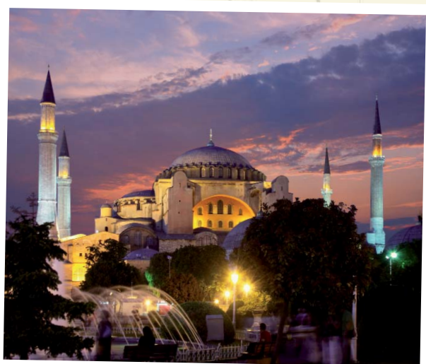
Istanbul - Hagia Sofia im Abendlicht