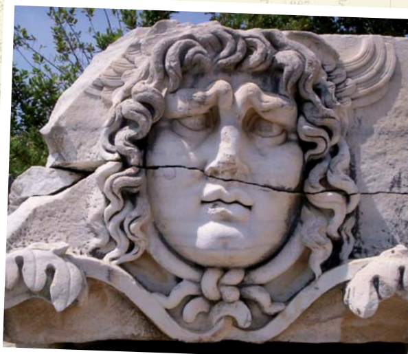
Didyma - Medusenhaupt