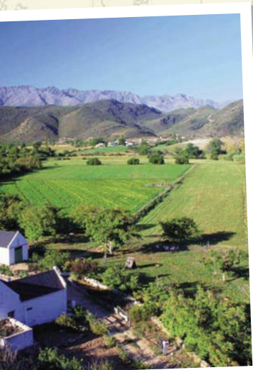
Winelands - Weingut bei Stellenbosch