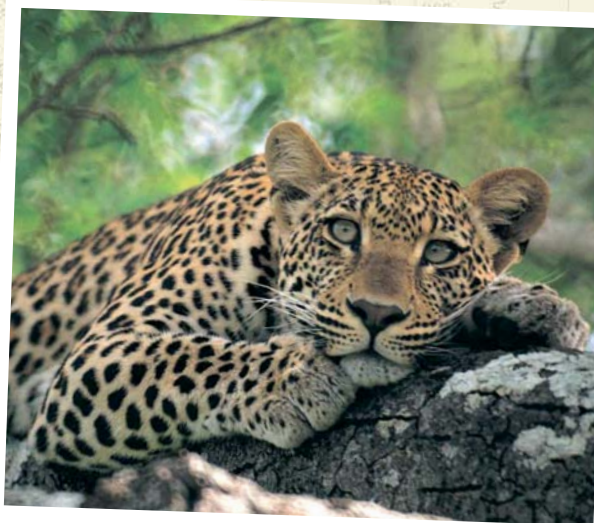
Leopard - Krüger Nationalpark