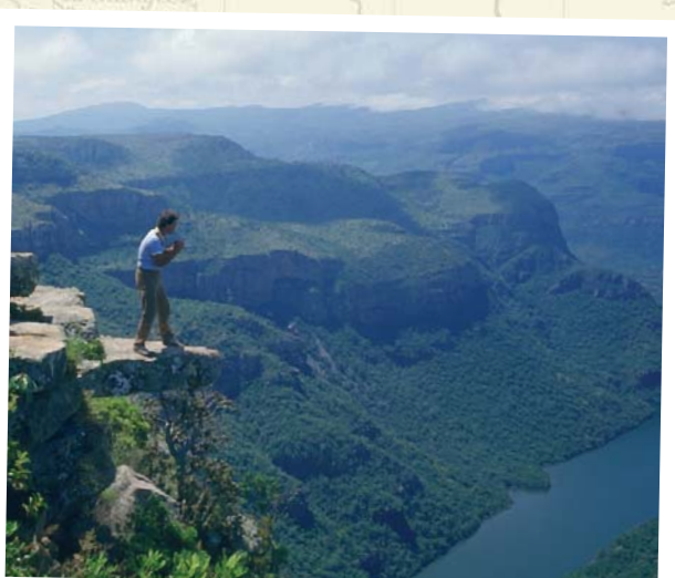
Blyde River Canyon