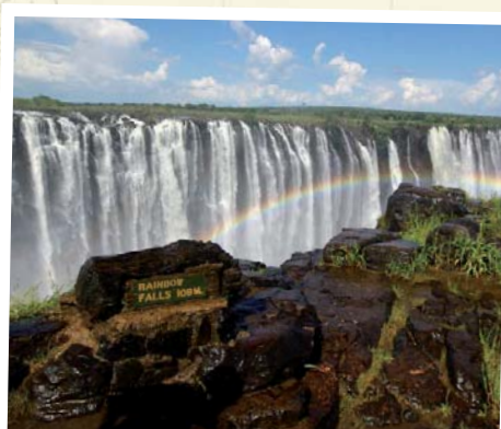
Verlängerung: die mächtigen Victoriafälle

Leistungen der Verlängerung siehe rechts.