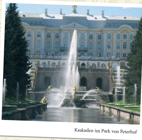
Kaskaden im Park von Peterhof