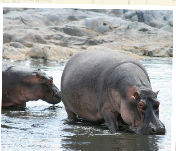
Tansania - Nilpferdpool im Ngorongoro Krater