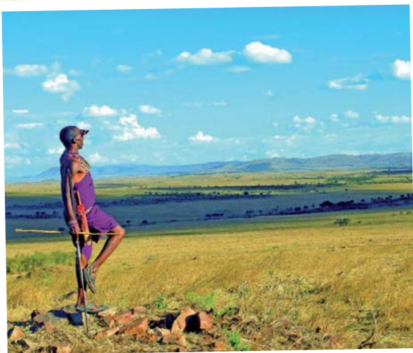
Kenia - Masai Mara Nationalpark