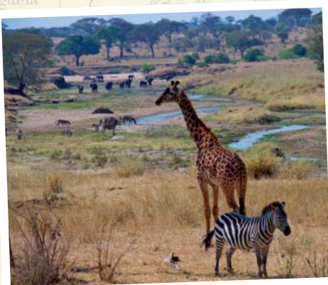
Tansania - Serengeti Nationalpark

Veranstalter: Scharff Reisen in Kooperation mit FOX-TOURS Reisen GmbH