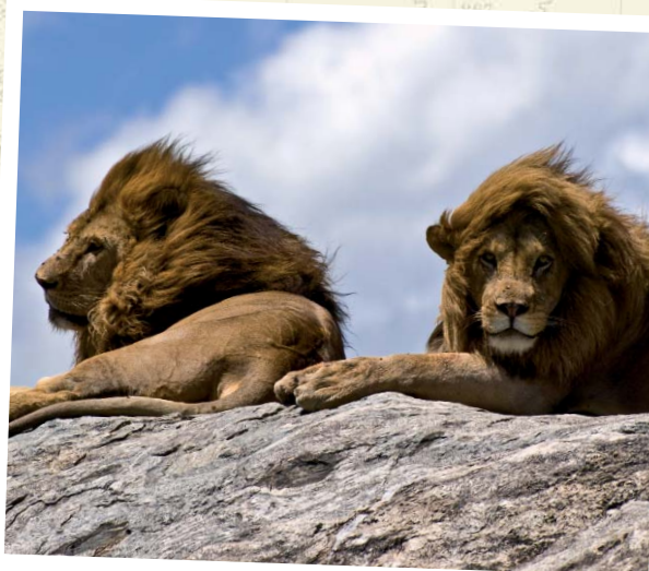
Tansania - Löwen im Serengeti Nationalpark