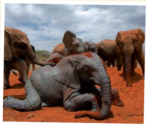
Kenia - die „roten Elefanten“ im Tsavo Nationalpark