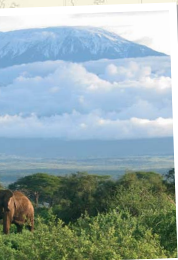
Druckende Kulisse in beiden Ländern - der Kilimandjaro